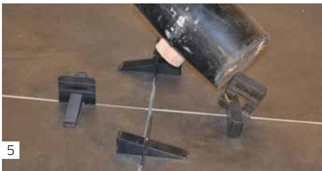
5 Nach Trocknung Zugplatten abtrennen