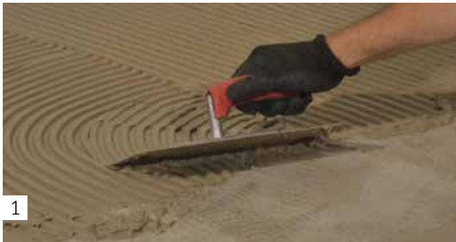
1 Auftragen des Fliesenklebers