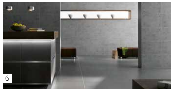
6 Ausfugen, fertig