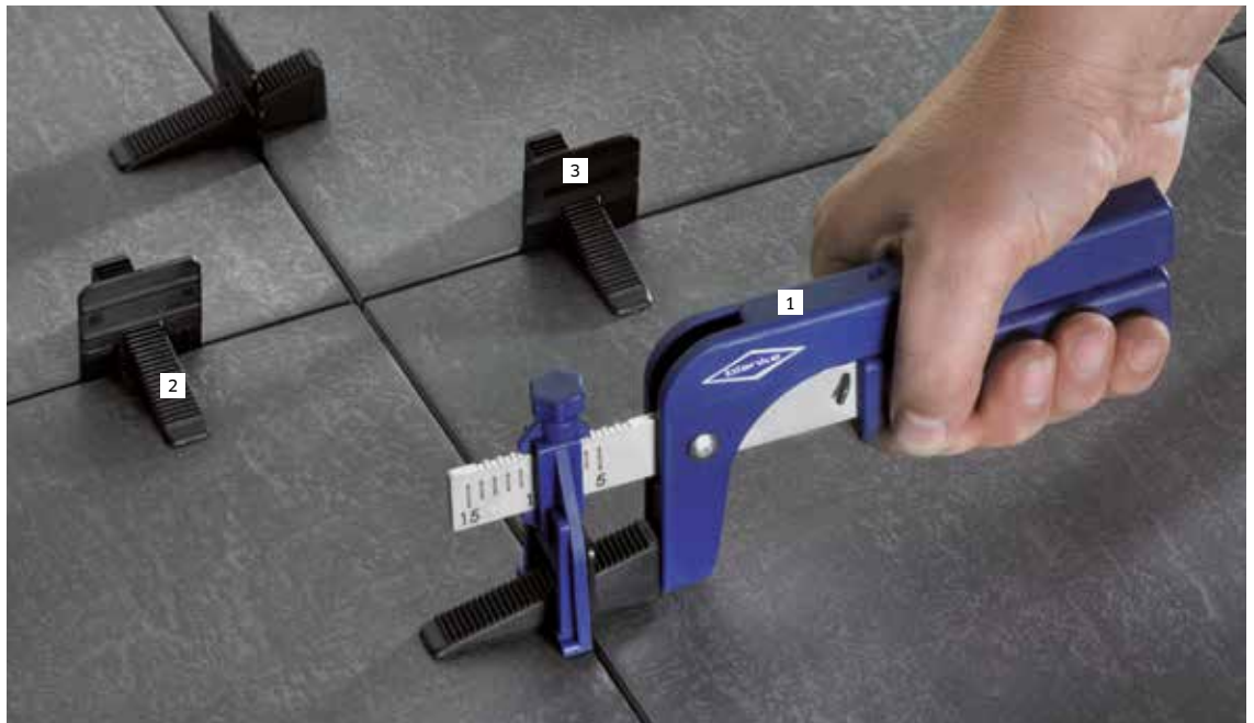
1 BLANKE LEVITO ZANGE 2 BLANKE LEVITO KEIL 3 BLANKE LEVITO T-ZUGPLATTE