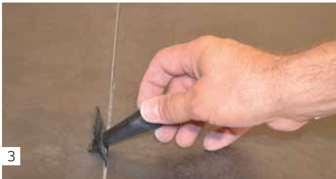
3 Einschieben der Spannkeile