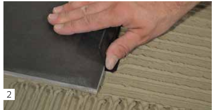
2 Einsetzen der Zugplatten