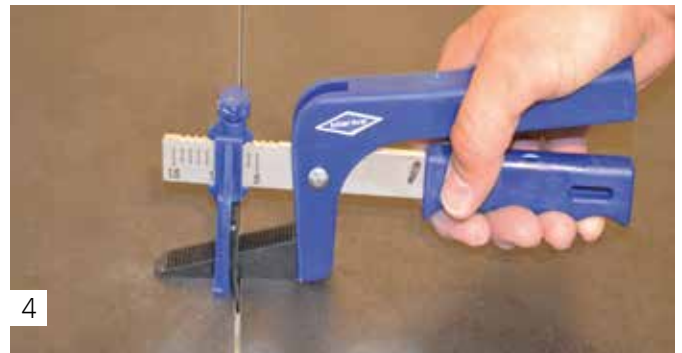
4 Keil einpressen, ausrichten der Fliesen