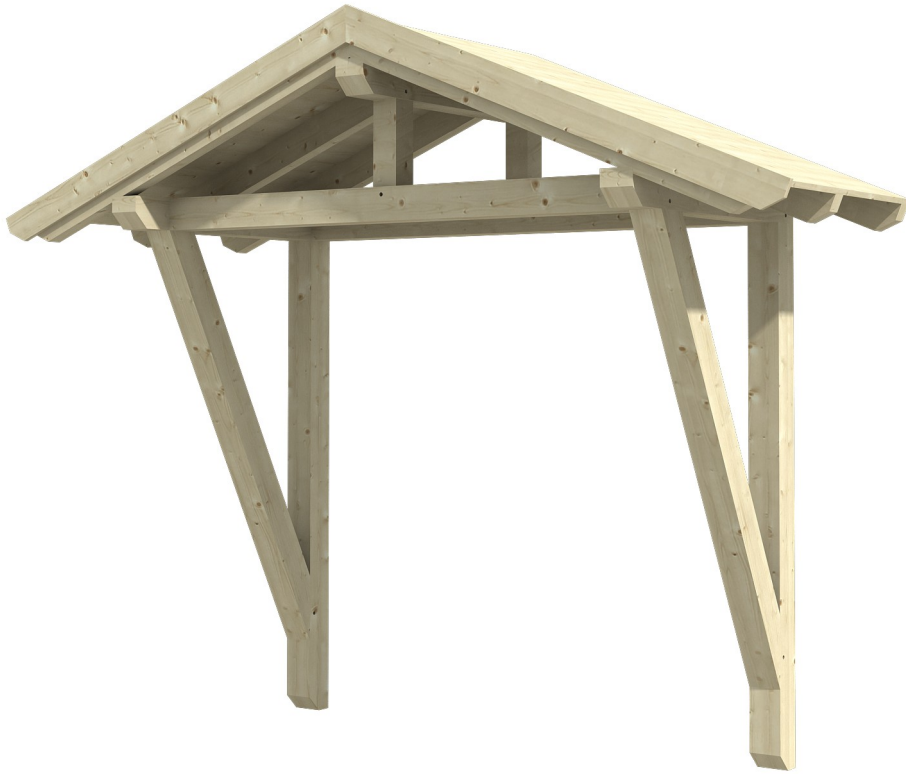
VORDACH STRALSUND 2 289 x 116 cm

Massive Konstruktion aus Konstruktionsvollholz (KVH-Fichte)