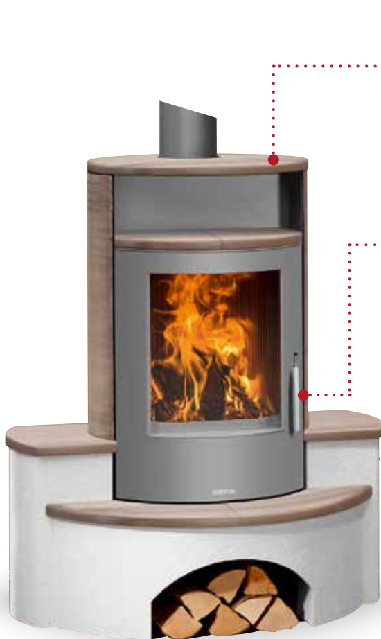
Kaskade 2.0 Keramik Grappa, Korpus Stahl Gussgrau