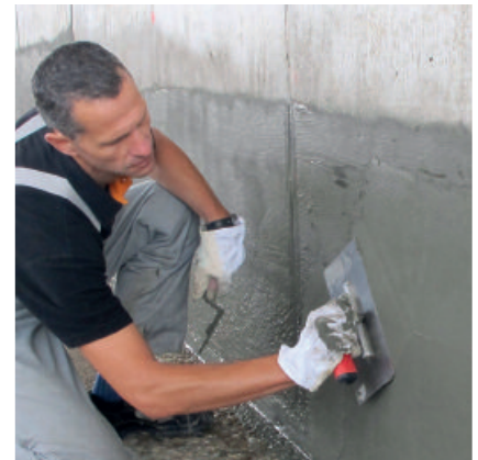
PCI Barraseal ist plastisch-geschmeidig. Poren und Vertiefungen werden leicht und schnell geschlossen.