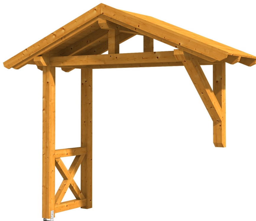
VORDACH STRALSUND 3 289 x 116 cm

Massive Konstruktion aus Konstruktionsvollholz (KVH-Fichte)