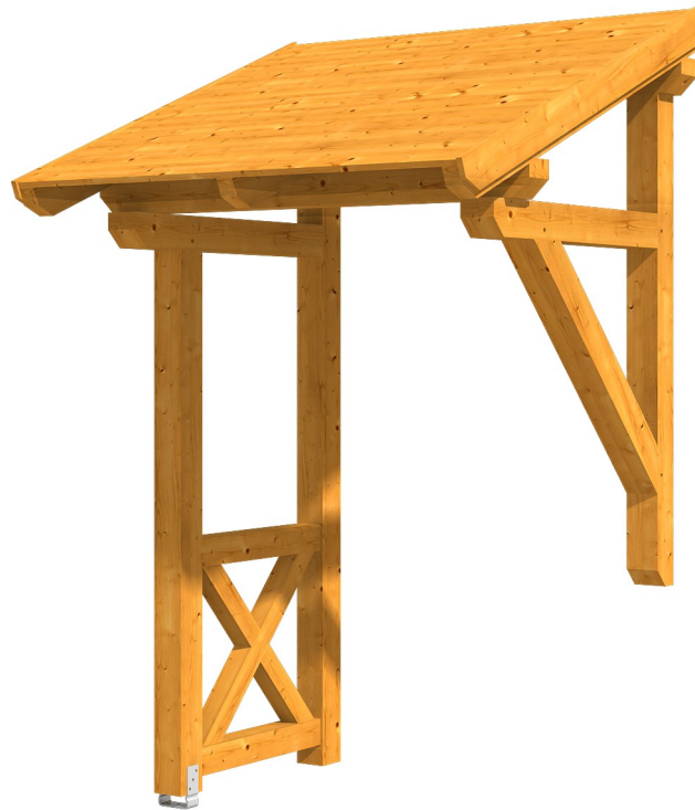
VORDACH POTSDAM 3 176 x 156 cm

Massive Konstruktion aus Konstruktionsvollholz (KVH-Fichte)