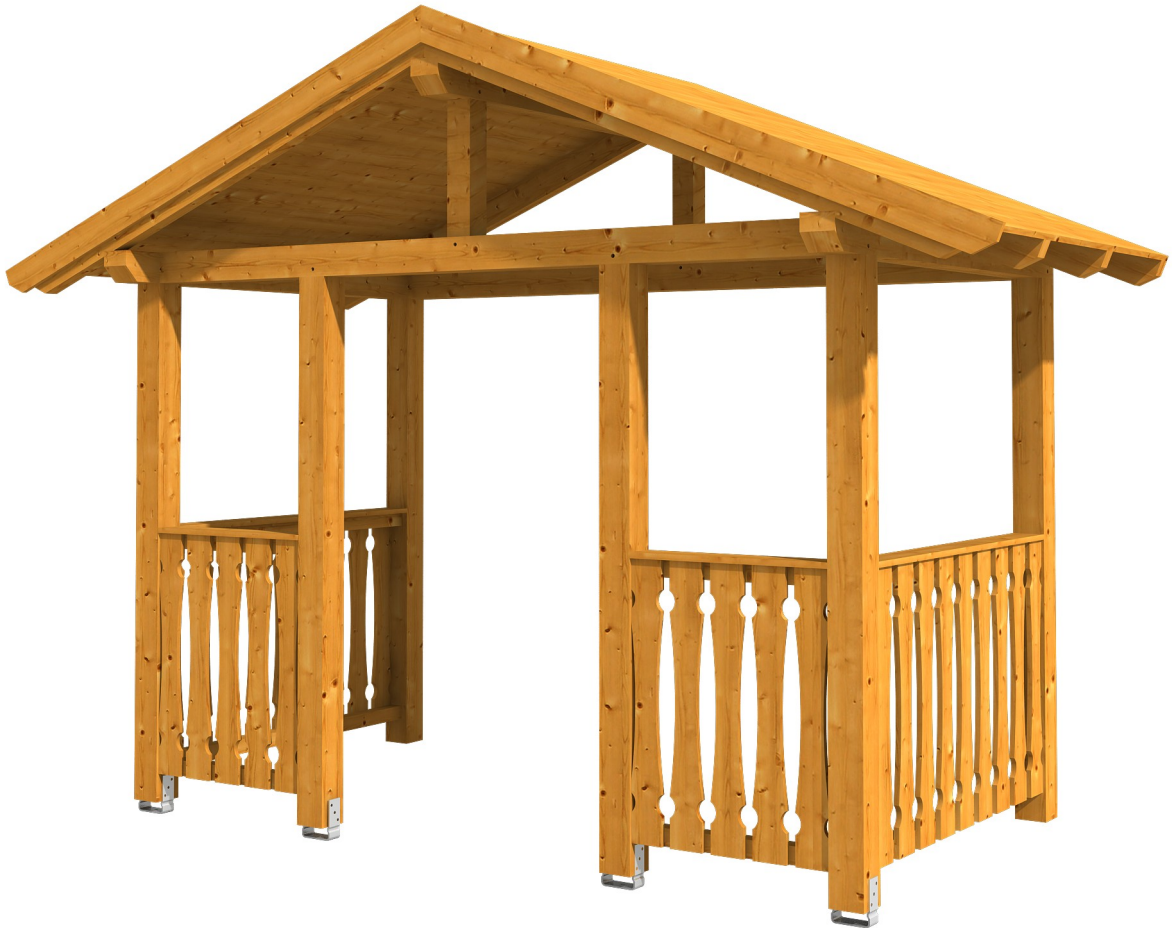
VORDACH STRALSUND 8 360 x 187 cm

Massive Konstruktion aus Konstruktionsvollholz (KVH-Fichte)