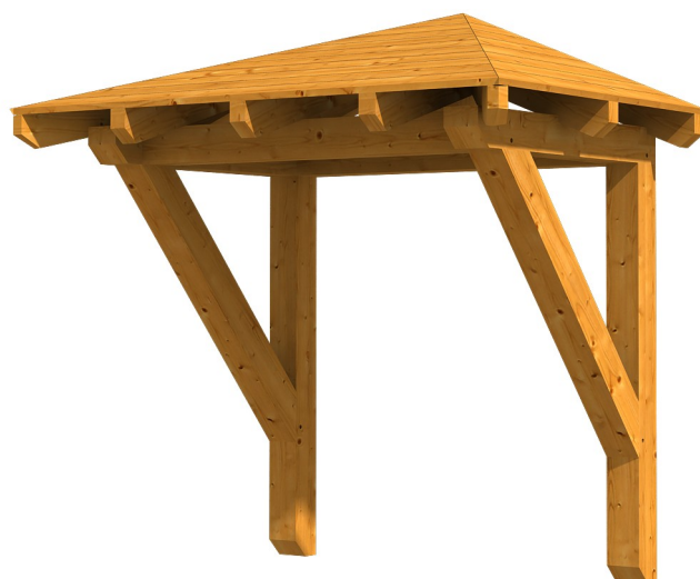
VORDACH WESEL 1 188 x 126 cm

Massive Konstruktion aus Konstruktionsvollholz (KVH-Fichte)