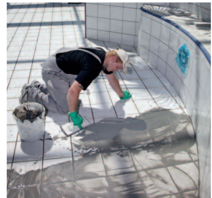
PCI Durafug NT zum Verfugen von keramischen Belägen mit erhöhter mechanischer Belastung und Beanspruchung, z. B. in Schwimmbädern.