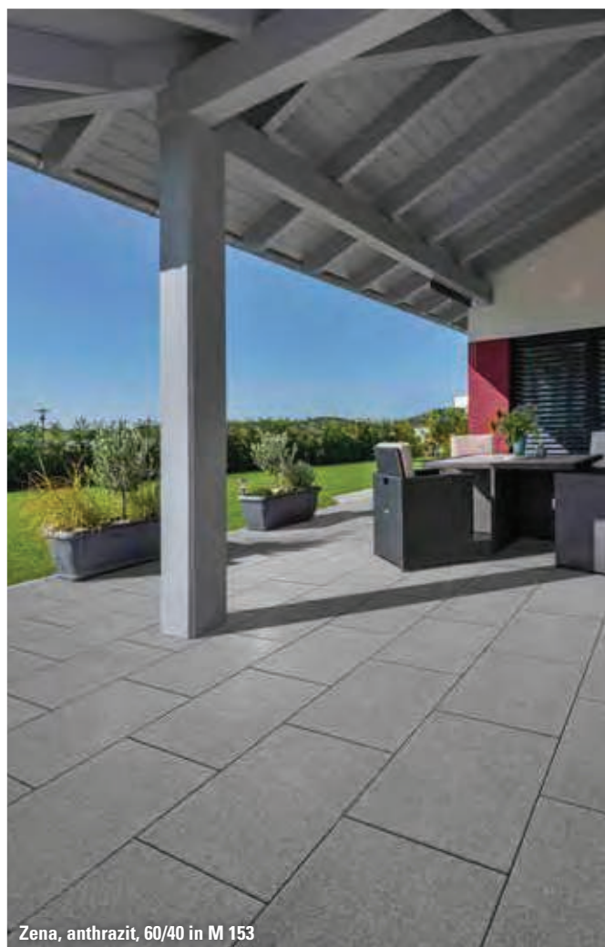
Zena, anthrazit, 60/40 in M 153