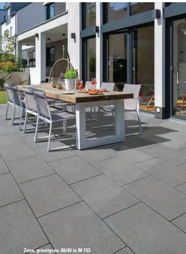
Zena, granitgrau, 60/40 in M 153