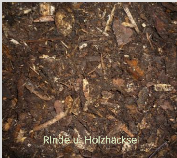
Rinde u. Holzhäcksel

Das Produkt dient als Grundschrift unter Mittel- und Vegetationsschicht bei Anlage eines Hochbeetes. Zur Verbesserung der Drainagefähigkeit und Vermeidung von Staunässe in der unteren Schicht eines Hochbeetes.