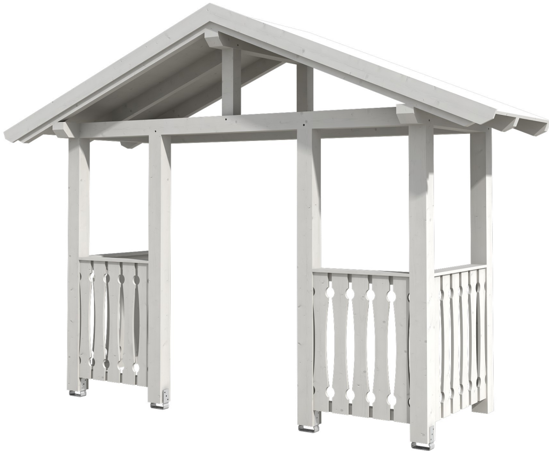
VORDACH STRALSUND 6 360 x 139 cm

Massive Konstruktion aus Konstruktionsvollholz (KVH-Fichte)