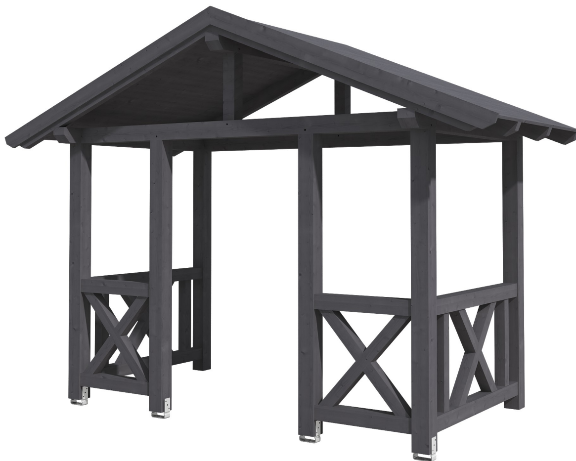
VORDACH STRALSUND 7 360 x 187 cm

Massive Konstruktion aus Konstruktionsvollholz (KVH-Fichte)