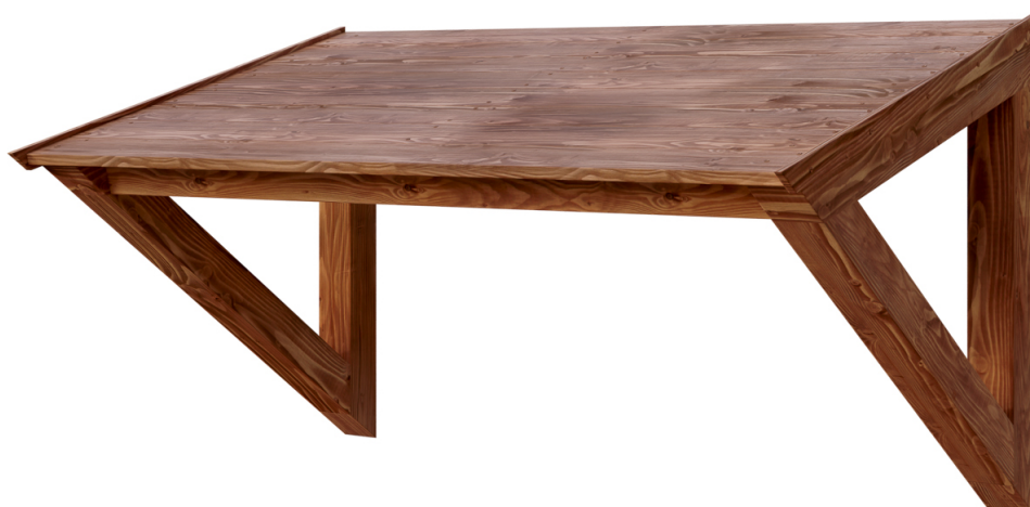
VORDACH POEL 148 x 87 cm

Massive Konstruktion aus hochwertiger Douglasie