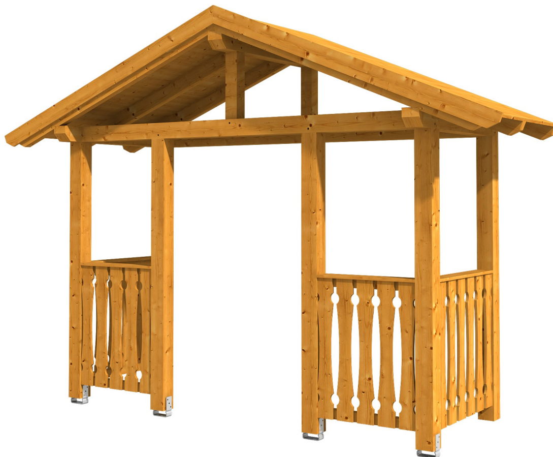
VORDACH STRALSUND 6 360 x 139 cm

Massive Konstruktion aus Konstruktionsvollholz (KVH-Fichte)