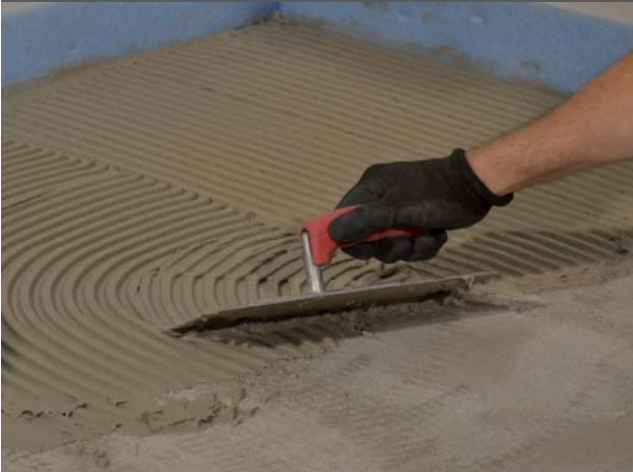
1. Auftragen des Fliesenklebers