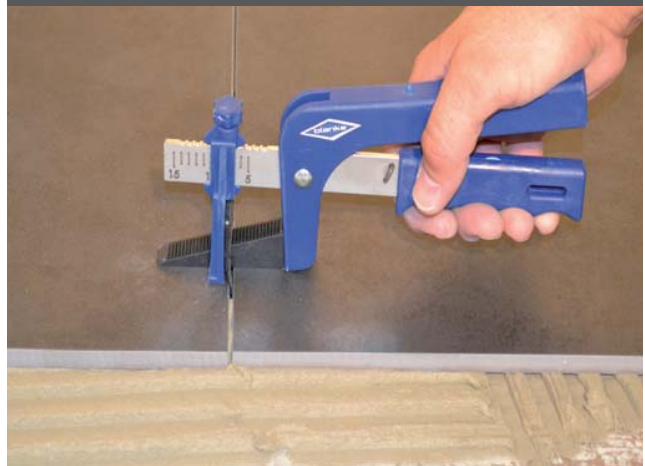
4. Keil einpressen, ausrichten der Fliesen