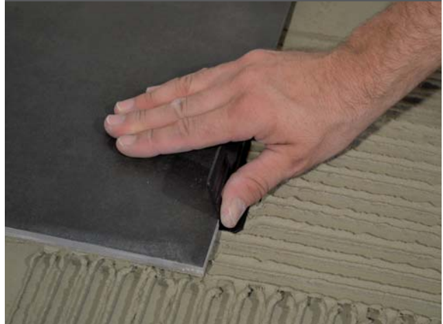
2. Einsetzen der Zugplatten