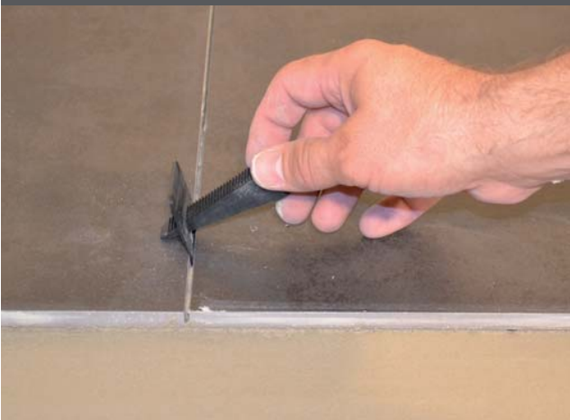
3. Einschieben der Spannkeile