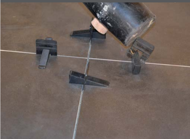
5. Nach Trocknung Zugplatten abtrennen