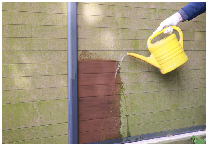
7. Zum Abspülen klares Wasser aus der Gießkanne ...