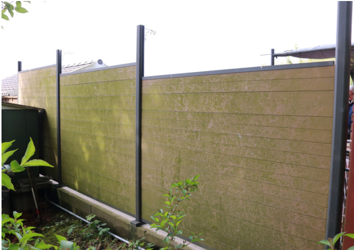
1. Nach Jahren sind die Pfosten und die Zaunfelder mit Grünalgen verschmutzt.