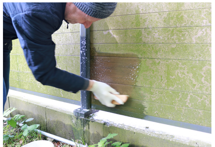
6. Mitunter so lange die Reinigung fortsetzen, bis das gewünschte Ergebnis erreicht wird.