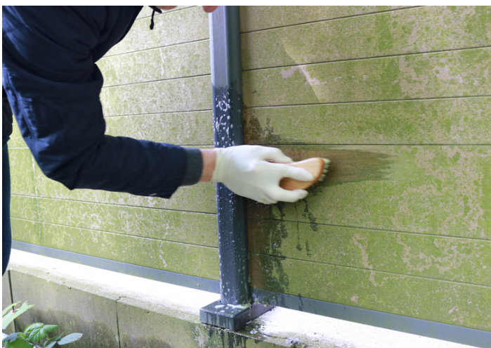
5. Bei der Reinigung immer in Faserrichtung bürsten!