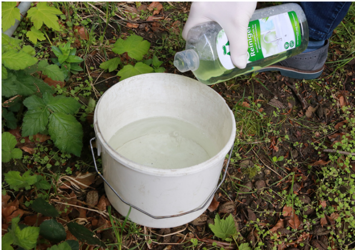
3. Den Essigreiner nach Angaben des Herstellers dosieren.