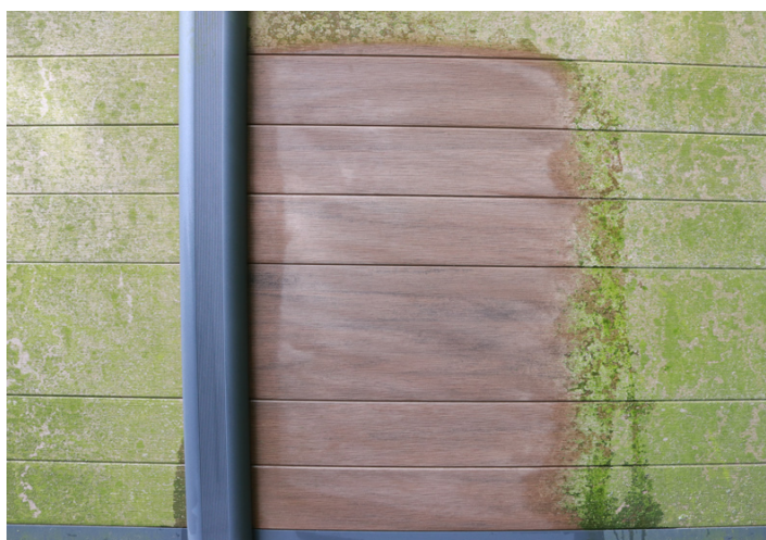
9. Die Trocknung beginnt und ...