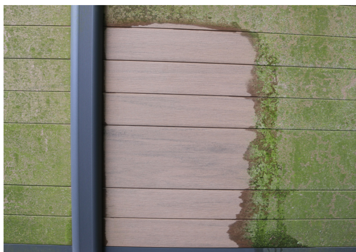
10. ... die Schönheit des Zaunes ist wieder sichtbar.