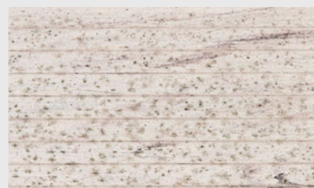
Stockflecken/Schimmel auf der Oberfläche

Kleine dunkelschwarze, oberflächliche Stockflecken auf den WPC-Elementen lassen sich im Außenbereich nicht immer vermeiden.