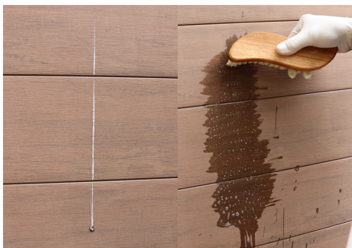
11. Auch bei Vogelkot gehen Sie wie zuvor beschrieben vor.