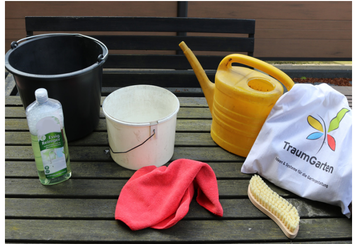
2. Zur Reinigung warmes Wasser, Essigreiniger, Wurzelbürste. Zum Abspülen Wasser und Gießkanne, ggf. Handschuhe, Schutzbrille. Optional Tuch.