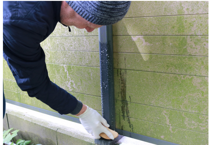
4. Die zu behandelnden Stellen mit der Wurzelbürste bearbeiten.