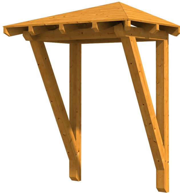
VORDACH WESEL 2 188 x 126 cm

Massive Konstruktion aus Konstruktionsvollholz (KVH-Fichte)