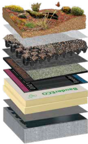
BauderECO F 0°-Dach mit Gründach-Aufbau

Mit unseren BauderECO Produkten bieten wir einen PU-Hochleistungsdämmstoff an. Dieser wird unter Einsatz von 80 % Biomasse gemäß Massenbilanzansatz hergestellt.