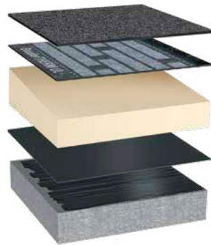
BauderECO T mit Gefälle

BauderECO F in Verbindung mit einem Gründach ist gleich doppelt nachhaltig. Dachbegrünungen sind eine wichtige ökologische Ausgleichsmaßnahme zur Flächenversiegelung, welche die perfekte Ergänzung zum Dämmstoff BauderECO darstellt.