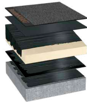
BauderECO KOMPAKT Kompaktdach

Das BauderECO T Gefälledach bietet den idealen Wasserabfluss auf dem Dach. Das vorgeplante Gefälle kann in einem Arbeitszug verlegt werden und schafft somit die idealen Bedingungen für fast jede Gefälleausführung.