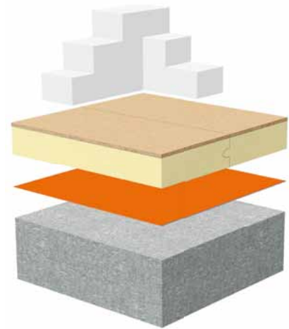
Dämmung des Kellerbodens mit BauderPIR DHW