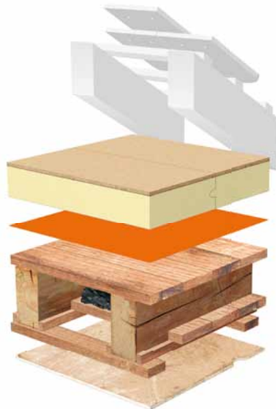
Dämmung der obersten Geschossdecke mit BauderPIR DHW auf Holzbalkendecke

BauderPIR DHW/DGF kann sowohl im Alt- als auch im Neubau eingebaut werden. Es verringert den Wohnraum nur minimal, verbessert den Wärmeschutz maximal und schafft sofort eine begehbare sowie belastbare Ebene.