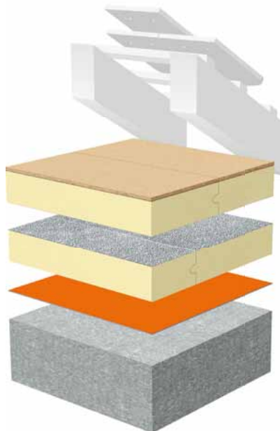
Dämmung der obersten Geschossdecke mit BauderPIR DAL und BauderPIR DHW auf Betondecke für höchste Anforderungen an den Wärmeschutz (Vorgaben KfW etc.)

BauderPIR DAL kann immer dort in Kombination mit BauderPIR DHW/DGF eingesetzt werden, wo höchste Ansprüche (z.B. KfW-Vorgaben) an den Wärmeschutz gestellt werden. BauderPIR DAL wird dann als erste Lage, BauderPIR DHW/DGF als zweite Lage verlegt.