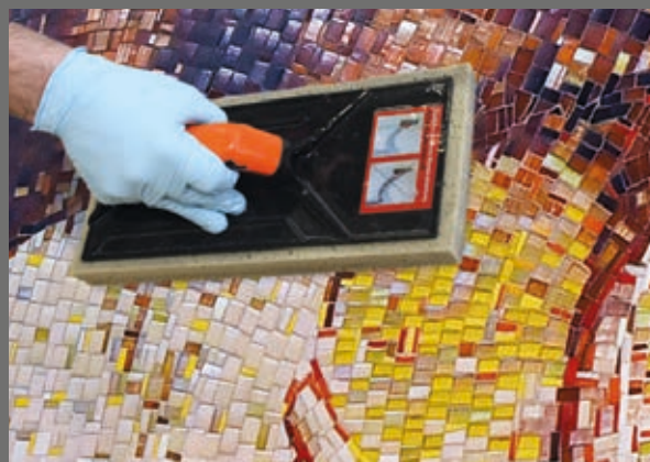
Sehr leichtes Waschverhalten ohne Restschleier – mit der Waschlösung PCI Durapox® Finish.