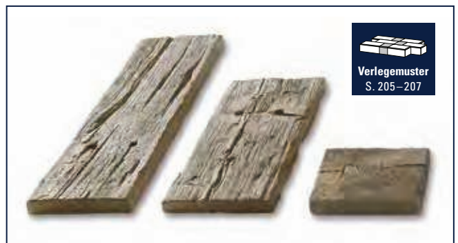
Verlegemuster S. 205–207