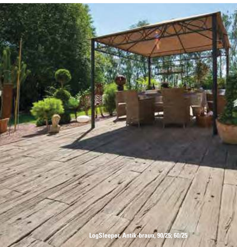
LogSleeper, Antik-braun, 90/25; 60/25

1) Eisenbahnschwellenoptik 2) Hirnholzoptik