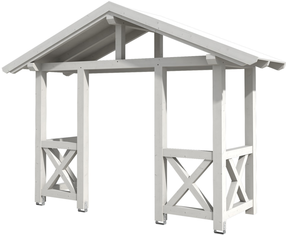
VORDACH STRALSUND 5 360 x 139 cm

Massive Konstruktion aus Konstruktionsvollholz (KVH-Fichte)