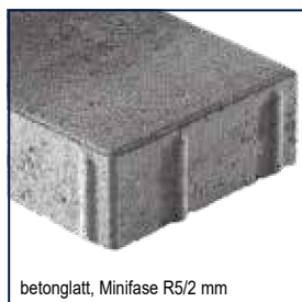
betonglatt, Minifase R5/2 mm