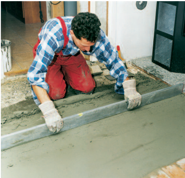
PCI Repament auf den vorbereiteten Untergrund in der gewünschten Schichtdicke einbringen und abziehen ...

5 Frisch eingebrachtes PCI Repament nur bei Außenanwendung und starker Wind- oder Sonneneinwirkung über einen Zeitraum von ca. 6 Stunden vor zu schneller Austrocknung schützen.