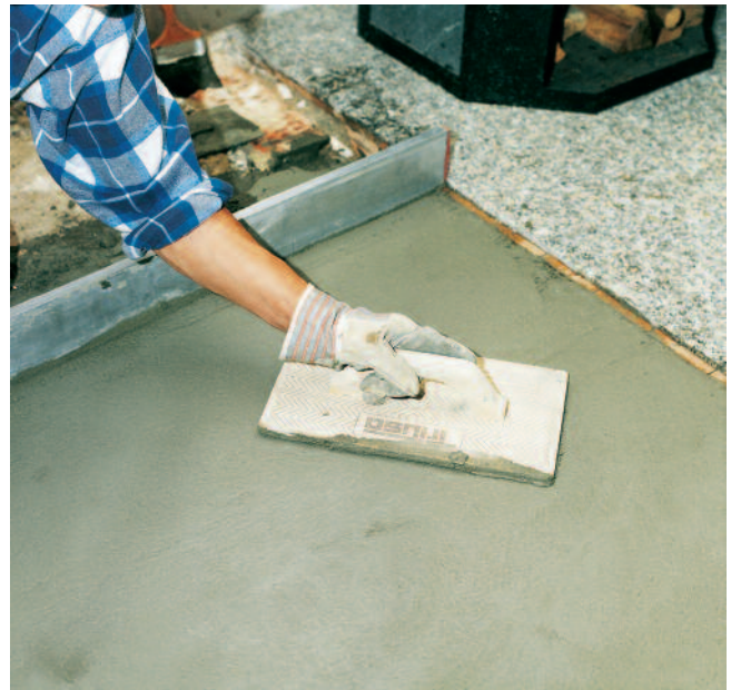
... mit einem Reibebrett verdichten und zureiben.