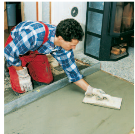
Die Fertigmörtelmischung PCI Repament härtet schwindungsarm und rissfrei aus.