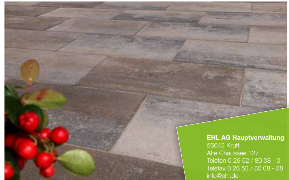
Farbe // muschelkalk

Verlegebeispiele zum jeweiligen Produkt finden Sie auf www.ehl.de