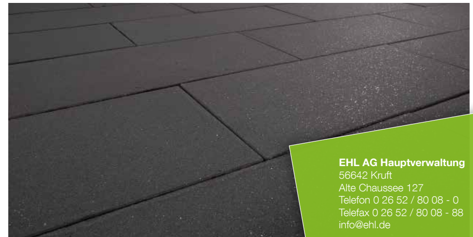
Farbe // anthrazit

Verlegebeispiele zum jeweiligen Produkt finden Sie auf www.ehl.de