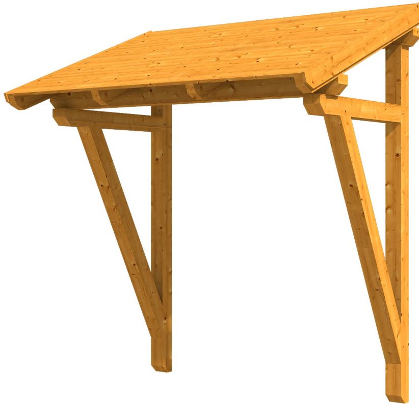
VORDACH PADERBORN 2 242 x 156 cm

Massive Konstruktion aus Konstruktionsvollholz (KVH-Fichte)